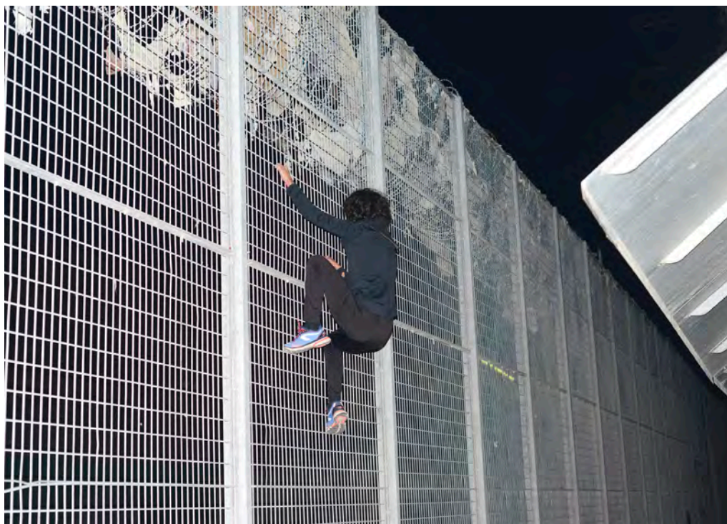
Arnaud Théval, Un œil sur le dos, GALERIE DES GLACES