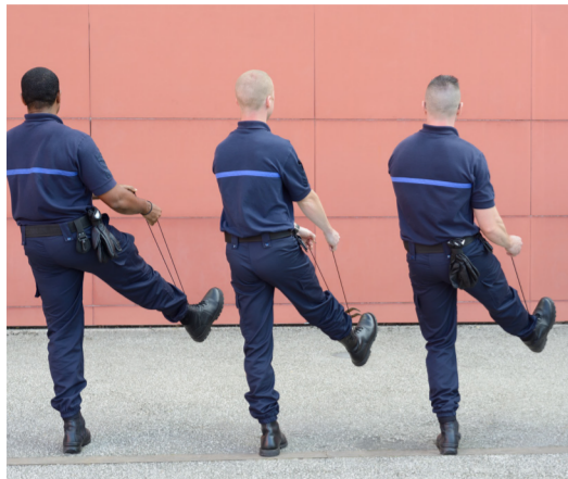
Le mur rouge (2014) - détail -travail avec l'implication d'élèves de la 187 ème promotion d'élèves surveillants

Épisode 6 du projet artistique d'Arnaud Théval_ octobre 2016 à l'Énap.