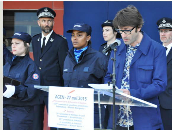
Un bleu parmi les bleus (2015) discours à la 187 ème promotion d'élèves surveillants