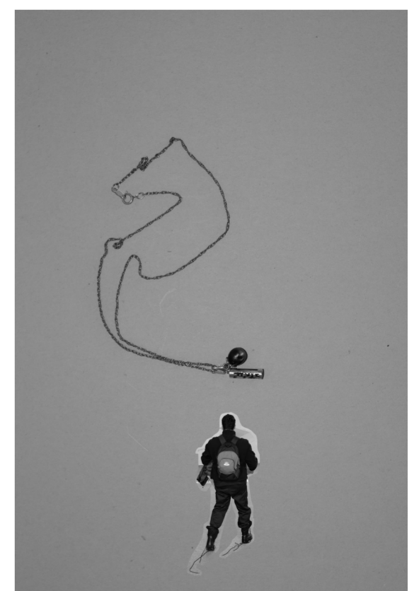
Les liens de l'émancipation (2016) détail, travail avec l'implication des élèves surveillants de la 190 ème promotion.

presque au yeux quand il dit «Ce sont neuf perles qui m'ont été confiées par ma femme lors de mon départ de Tahiti. Elle m'a dit de bien les garder car elles me protégeront lors de mon séjour en métropole et en cas de besoin je pourrai les utiliser. Pour moi, ce sont des perles magiques».