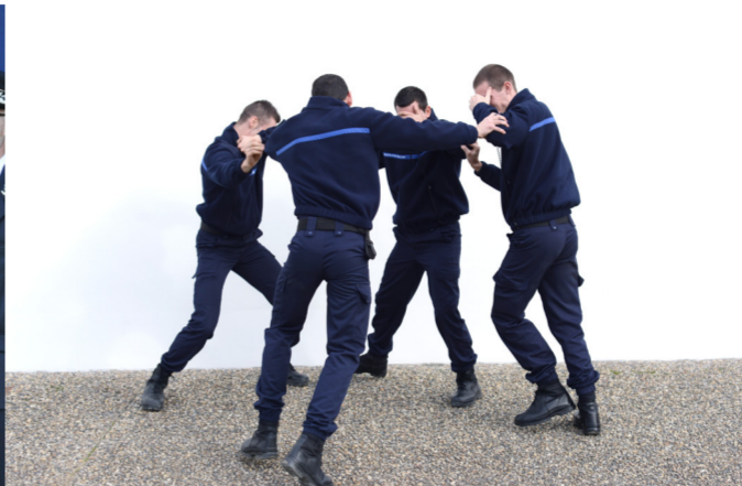
Scène au sifflet (2015) travail avec l'implication d'élèves de la 187 ème promotion d'élèves surveillants