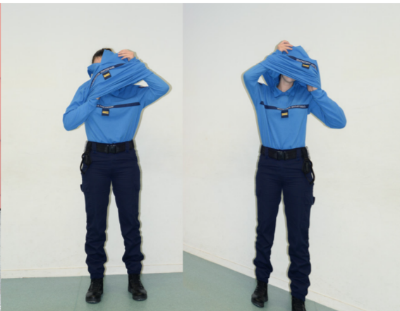
Une emprise totale (2016) travail avec l'implication d'élèves lieutenants de 20 ème promotion